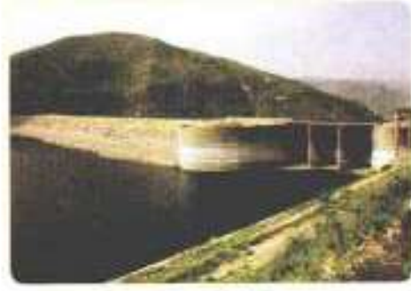
سد الملك طلال

منجزات حضارية في عهد الملك الحسين بن طلال :