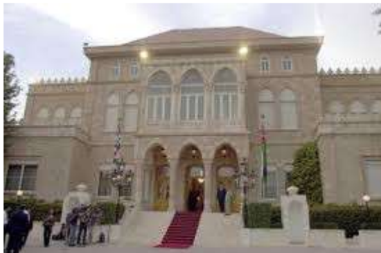
قصر رغدان العامر

عمّان : عاصمة المملكة الأردنية الهاشمية ، وهي مقرّ جلاله الملك ، وفيها المباني والوزارات المهمة . ومن أهم المعالم المعاصرة لمدينة عمّان الحديثة :