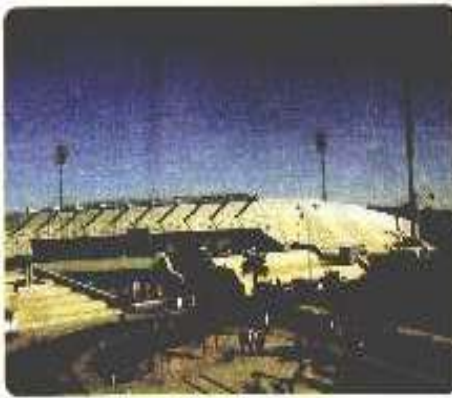
مدينة الحسين للشباب