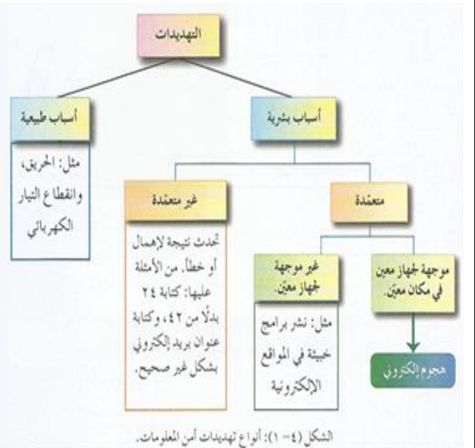
الشكل (٤-١): أنواع تهديدات أمن المعلومات.

أنواع المخاطر التي تهدد أمن المعلومات: ١. الثغرات ٢. التهديدات